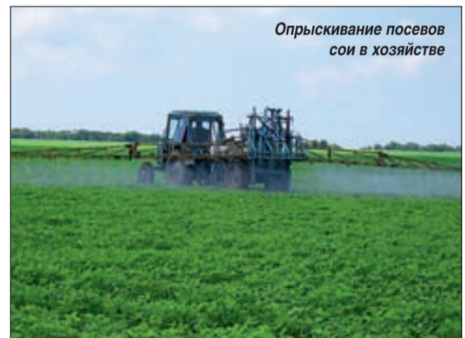
Опрыскивание посевов сои в хозяйстве

Не будем забегать вперед, будем понемногу подтягивать все направления. Главное, конечно, культура земледелия, а ее быстро не повысить. В прежнем совхозе никогда семян не протравливали и не опрыскивали, все проблемы в защите растений решали только вспашкой. А потом лет 10 - 12 эти земли никто не трогал вообще, они заросли бурьяном, обсеменили почву на много лет вперед. Тем более что соседские поля сильно засорены, пополнение запаса семян сорняков идет и оттуда. Так что очищение