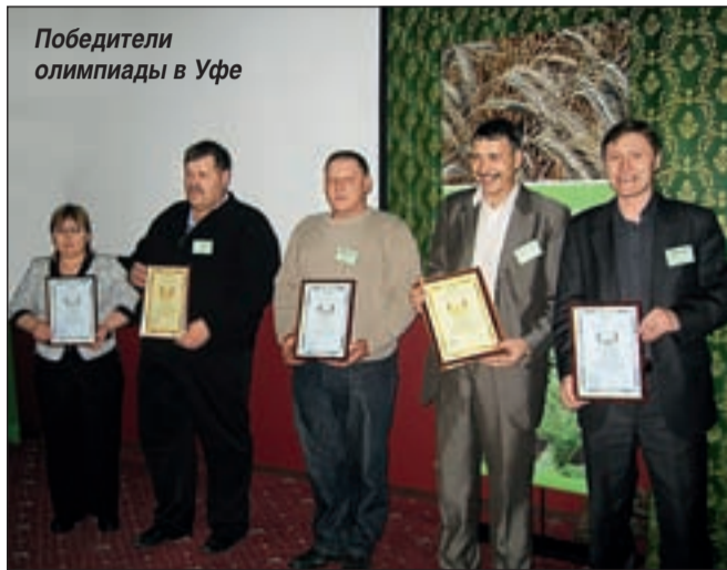
Победители олимпиады в Уфе

Мы уже рассказали в прошлом номере о проведенных фирмой «Август» в южных регионах страны агрономических олимпиадах по интенсивным технологиям возделывания основных сельскохозяйственных культур. На Кубани и в Ставропольском крае сразу же после проведения этих творческих соревнований начались посевные работы. Ну а олимпиады двинулись... на восток.