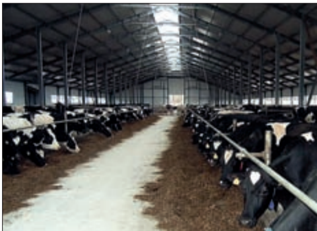
На новом молочном комплексе

С 90-х годов, когда соседи стали один за другим «прогорать» на рынке. Сначала присоединили Центральную опытную станцию