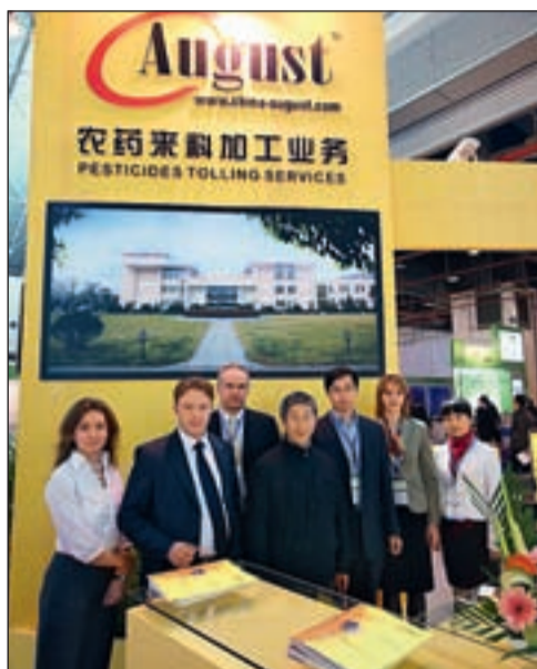
Команда СП «Августа» на выставке

В середине марта в г. Шанхай (Китай) состоялась 11-я международная выставка International China Agrichemical & Crop Protection Exhibition (CAC 2010 Exhibition).