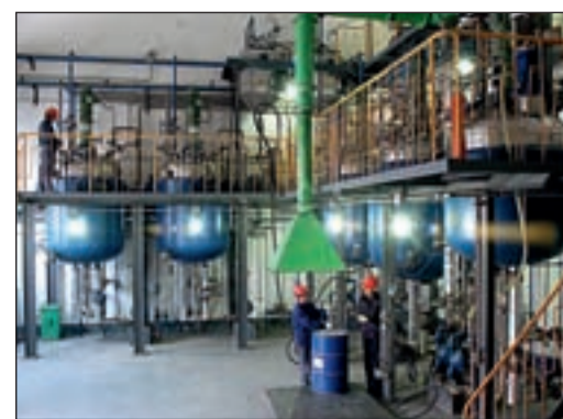
На заводе «Августа» в Чанджоу

Производственные мощности СП «Changzhou August Agrochem Company Ltd.» расположены на Бинджанской производственной высокотехнологичной площадке близ города Чанджоу провинции Цзяньсу. Завод оснащен новейшим оборудованием мирового класса, позволяющим выпускать современные формуляции пестицидов, такие как эмульсии масляно-водные, концентраты эмульсии, водно-суспензионные концентраты, водно-диспергируемые гранулы и т. д. Производственные мощности по жидким пестицидам составляют 7,2 тыс. т в год, по водно-диспергируемым гранулам – 1,2 тыс. т в год.