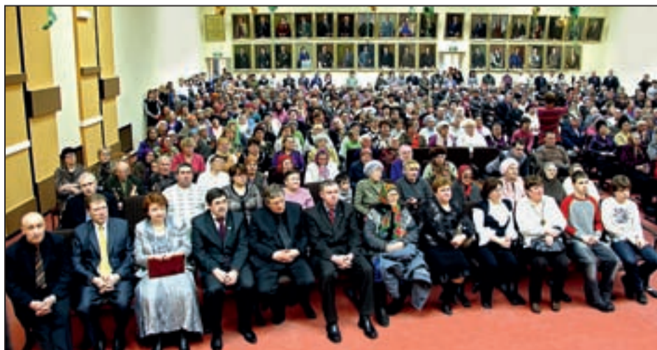
В зале торжественного заседания

Торжественная часть праздника прошла в актовом зале заводоуправления. В преддверии юбилея здесь произвели капитальный ремонт, и лишь портреты самых знатных труженников завода остались на своих местах.