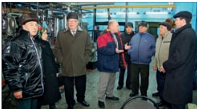
«В наше время таких станков не было...»

Фирма «Август» и ее филиал «ВЗСП» сертифицированы по трем международным стан-