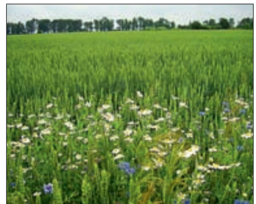
Поле пшеницы с полной защитой, на переднем плане – контроль без обработки

На посевах рапса трижды применяли колосаль. Первый раз осенью 2008 года в качестве ретарданта, а весной два раза: для защиты от альтернариоза и других болез-