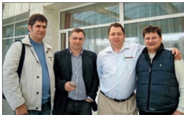
Давние партнеры ООО «АгроАнализ»

И третье направление – это, конечно, овощеводство, садоводство, виноградарство . Здесь мы можем предложить наиболее глубокое сотрудничество, готовы предоставлять полный консалтинг. Он включает вопросы технологии в целом, минерального питания, а также защиты растений, неразрывно связанной и с режимами орошения, и с правильными схемами и сроками посадки или посева и т. д. Фактически это реализация той самой