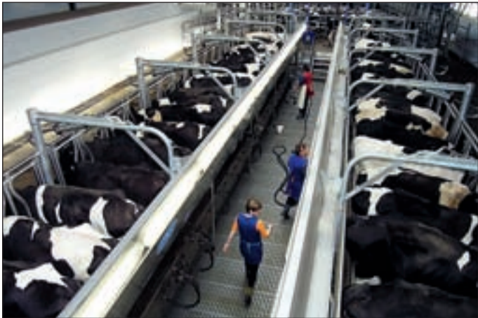
В доильном зале