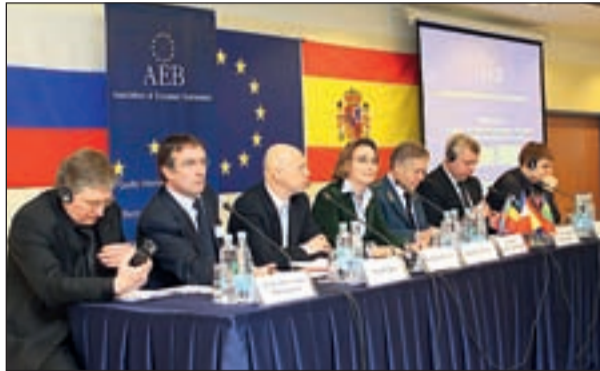
В президиуме заседания

10 марта в Представительстве Европейского Союза в Российской Федерации в Москве состоялось заседание «круглого стола» по вопросу «Борьба с контрафактной продукцией: объединение ресурсов и выработка эффективной стратегии».