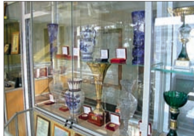
В музее племзавода «Барыбино»

В конце 60-х годов, когда я сюда пришел, люди здесь жили довольно бедно. На фермах, да и в полеводстве было много тяжелого ручного труда. Корма завозили на лошадях, раздавали вручную. Доярки надрылись с тележками и вилами, таскали тяжеленные корзины, по колени в жиже. С удалением навоза постоянно была морока. Доили только в линейные установки, молоко-