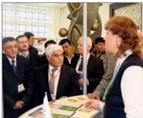
Беседа с руководителями сельского хозяйства Узбекистана

Многие препараты «Августа» уже завоевали широкую популярность у дехкан. Так, например, объемы применения дефолианта авгурон экстра на хлопчатнике в некоторые годы доходили до 200 тыс. га. Поэтому экспозиция компании привлекала постоянное внимание посетителей, за неполные три