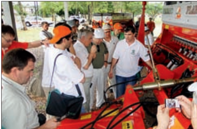
Осмотр сеялки «Semeato»

Интерес к «нулевой» технологии обработки почвы при выращивании сельхозкультур растет. В первую очередь, это объясняется тем, что при использовании No-till в значительной степени сокращается себестоимость продукции, что весьма актуально в ситуации, складывающейся в сельском хозяйстве России в последние годы. При внедрении этой технологии возникает много вопросов, и ответы на них «из первых рук» смогли получить земледельцы из различных уголков России, побывавшие в феврале в Бразилии по приглашению компании «Semeato».