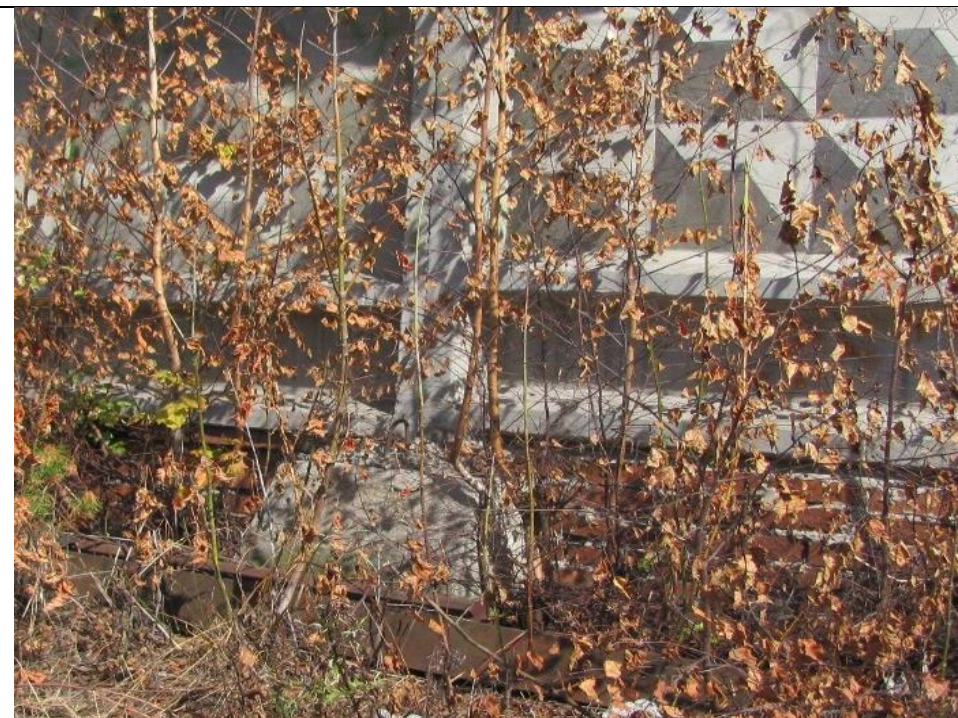
Продолжение фото 1