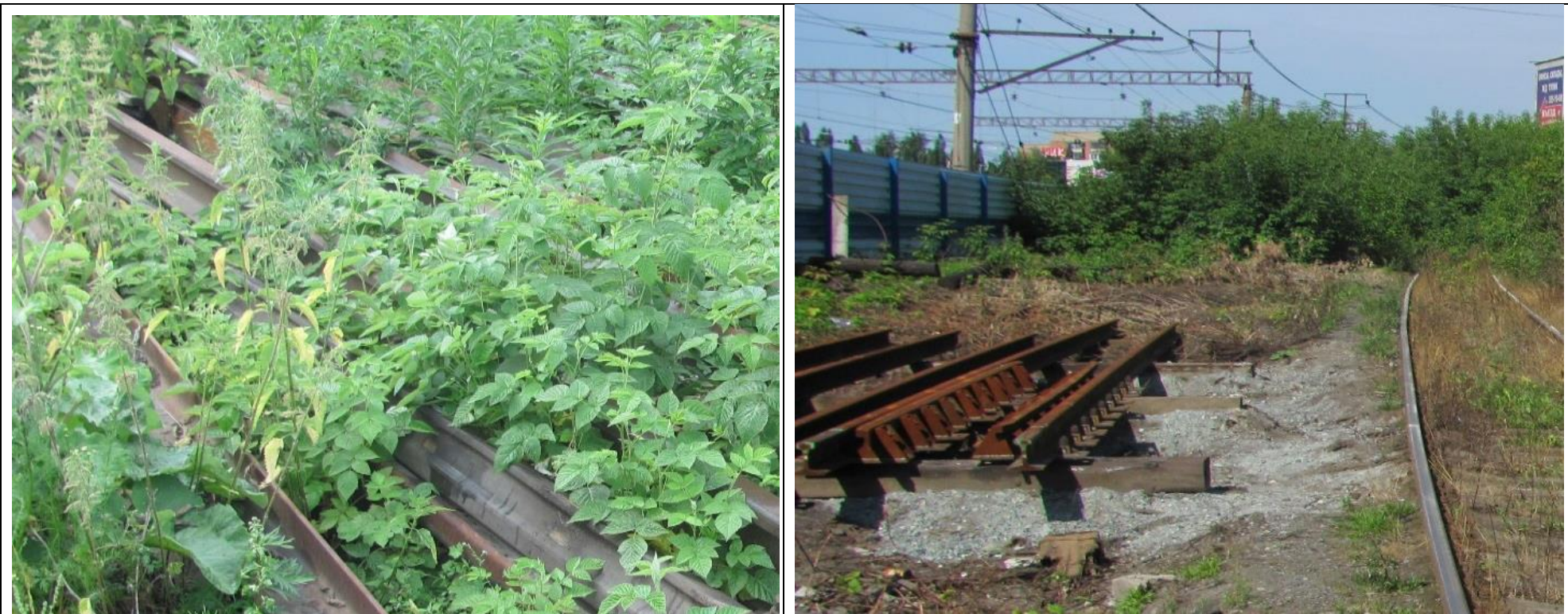
Фото 1 – Состояние объектов инфраструктуры до (слева) и через 47 дней (справа) после использования баковой смеси Грейдер (3,0) + Торнадо500 (3,0) + Адю (0,2)