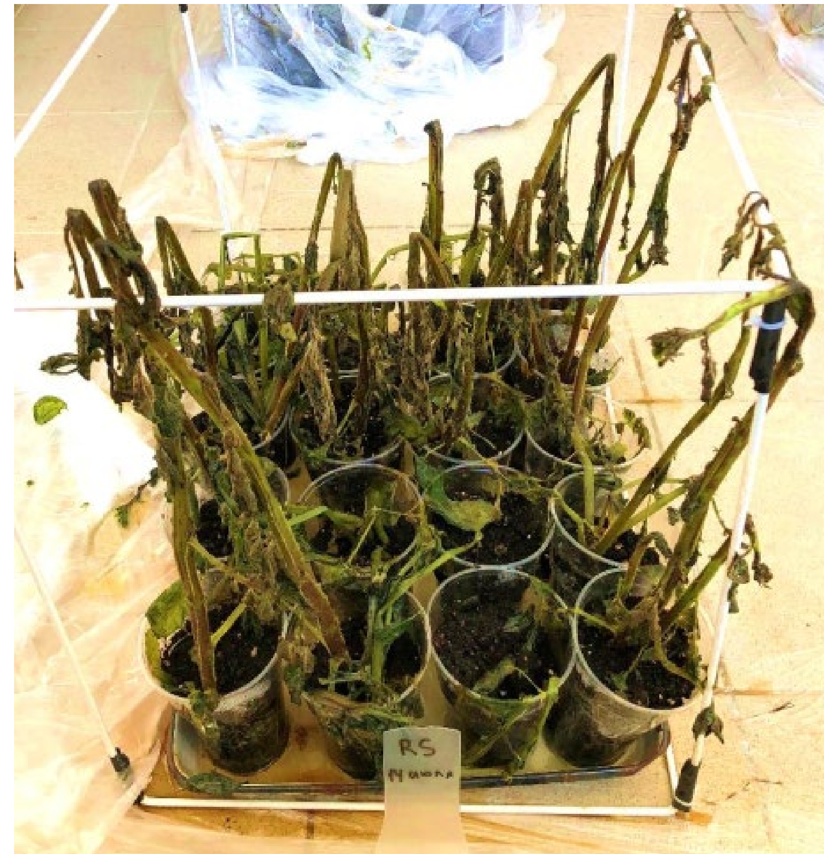
Контроль без обработки

ФИО докладчика. Наименование подразделения