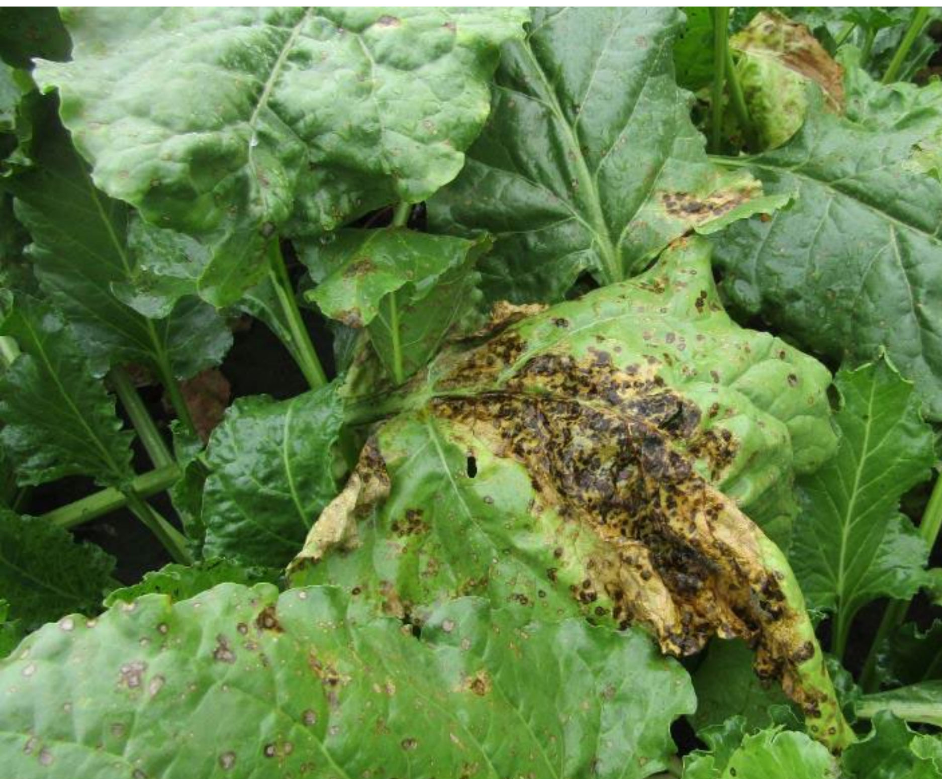
Контроль без обработки