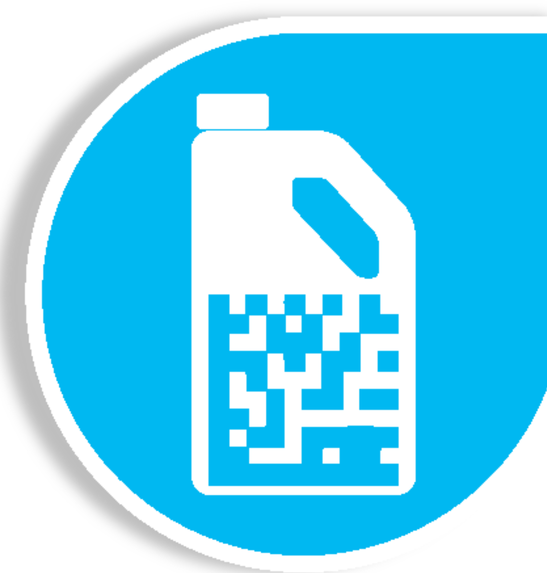
Август Чекер. Защита от контрафакта