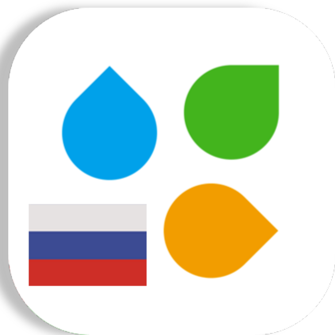
Каталог продукции для России и Беларуси