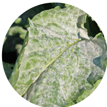
Мучнистая роса сахарной свеклы