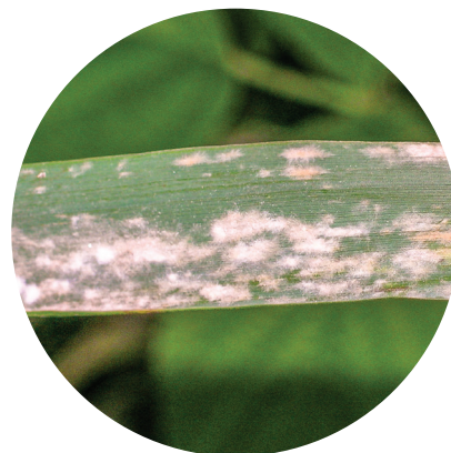
Мучнистая роса зерновых культур