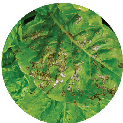
Церкоспороз сахарной свеклы