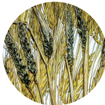
Твердая (каменная) головня ячменя

Кредо® совместим с другими пестицидами, кроме препаратов, обладающих сильнокислой или сильнощелочной реакцией.