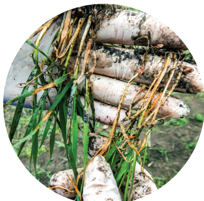
Фузариозная корневая гниль зерновых культур

На семенную инфекцию при протравливании семян и на патогены при опрыскивании по вегетации Кредо® начинает действовать через 2 – 4 часа после обработки.