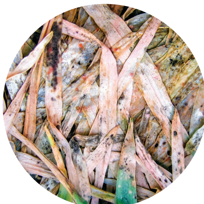
Снежная плесень зерновых культур