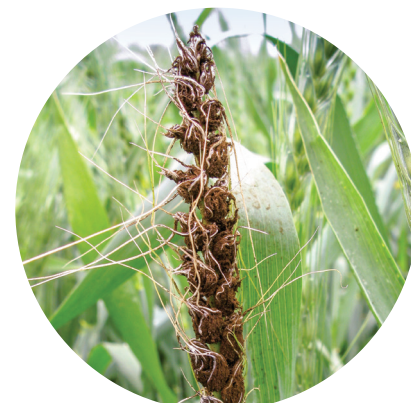
Пыльная головня пшеницы