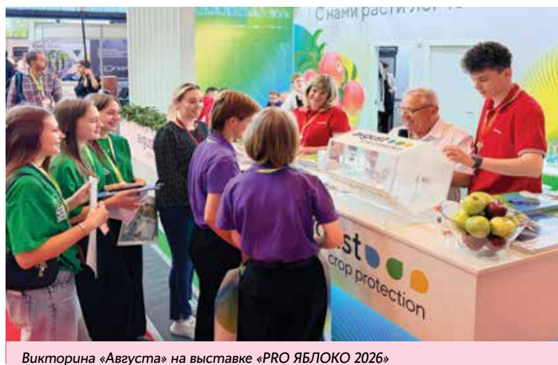
Викторина «Августа» на выставке «PRO ЯБЛОКО 2026»

Международную выставку технологий выращивания, хранения и сбыта плодовой и ягодной продукции