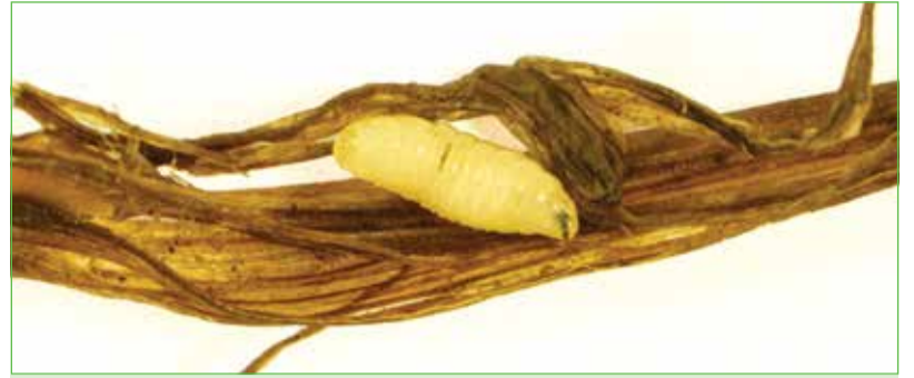
Личинка злаковой мухи третьего возраста

По результатам учета имаго мух, при их нашествии возможно применение пиретроидов или комплексных продуктов на основе неоникотиноидов. Взрослая муха легко