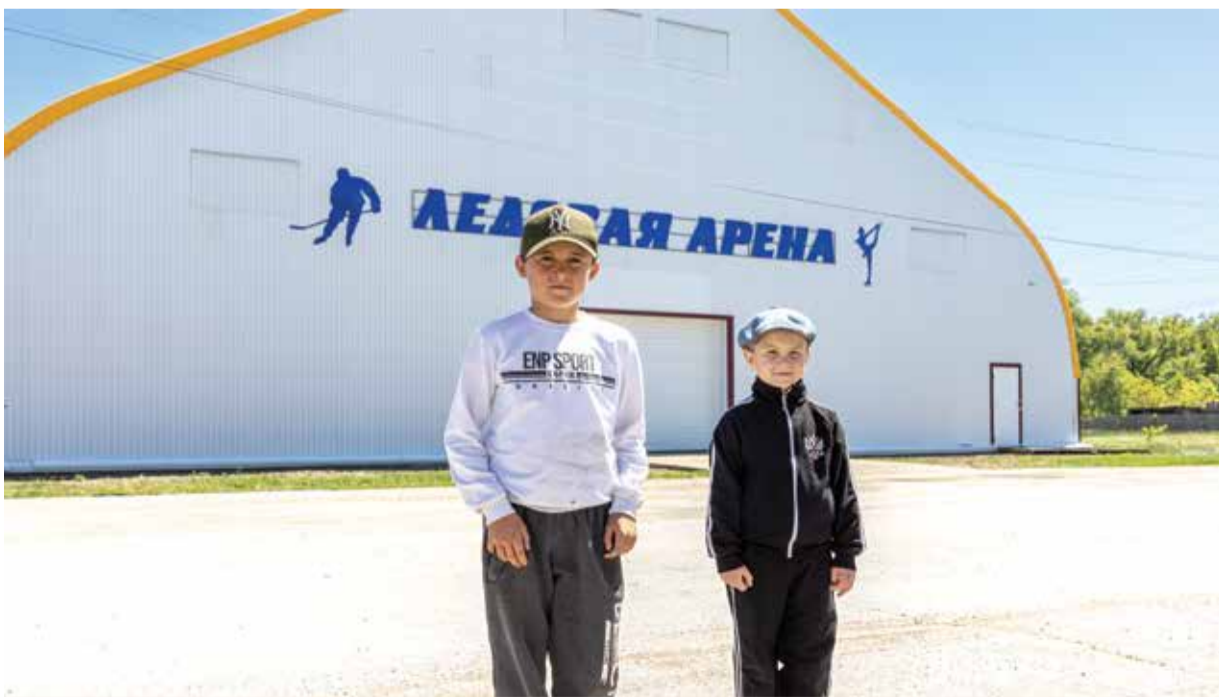
Местная детвора на фоне ледовой арены