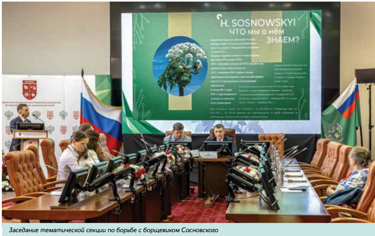
Заседание тематической секции по борьбе с борщевиком Сосновского

Масштабная международная конференция «Инвазивные виды как потенциальная угроза биологической безопасности России: вызовы и риски» прошла с 26 по 29 мая 2026 года.