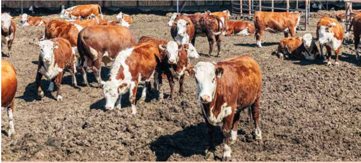
КРС породы казахская белоголовая

пород мне больше всего приглянулась казахская белоголовая, она как нельзя лучше приспособлена к суровым условиям Западной Сибири – и к морозам, и к засухам. Отличается крайней неприхотливостью. Собирает скот по всему Алтайскому краю. Спусти некоторое время занялся улучшением, подключил науку – Алтайский НИИ животноводства и ветеринарии. Завозил племенных быков, высокоценное семя. Это дало результат: в 2015 году наше хозяйство получило статус племенного завода.