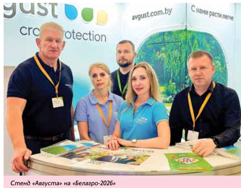
Стенд «Августа» на «Белагро-2026»

Много вопросов было связано с защитой растений в условиях изменяющегося климата и растущей резистентности отдельных вредных объектов, таких как колорадский жук, дрема белая, куриное просо и другие. Традиционно обращались и владельцы личных подсобных хозяйств, которые активно используют препараты компании на своих участках. Особенно востребованными оказались консультации по уходу за газоном и защите