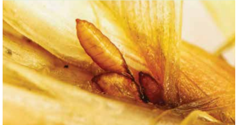
Пупарий гессенской мухи у основания побега