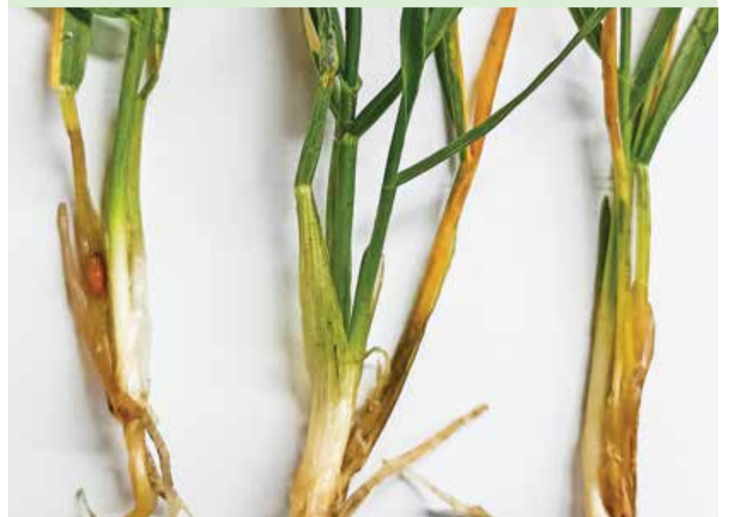
Повреждения озимой пшеницы злаковыми мухами