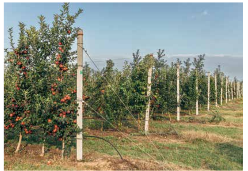
Яблоневый сад «Анжелины»

Против мучнистой росы и парши яблоню и грушу обрабатывают двухкомпонентным фунгицидом пролонгированного действия Геката на основе дифеноконазола и тетраконазола. Также эти культуры против парши, мучнистой росы и альтернариоза опрыскивают новым фунгицидом Шриланк на основе дифеноконазола и масла чайного дерева».