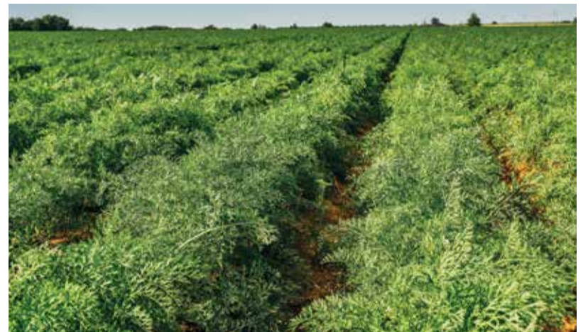
Морковь под «августовской» защитой, Волгоградская область

* - идет регистрация препарата для применения на указанной культуре